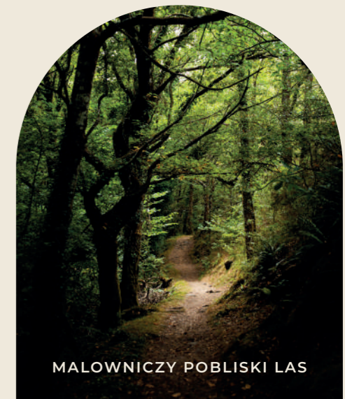
MAŁOWNICZY POBLISKI LAS