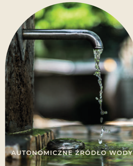
AUTONOMICZNE ŹRÓDŁO WODY

Mieszkańcy mogą korzystać z takich atutów jak: